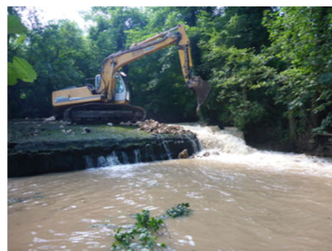
Première phase des travaux, ouverture de l'ouvrage, 2018