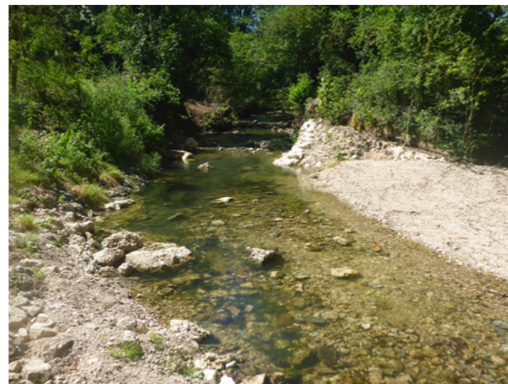
Site après travaux, 2019