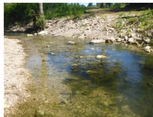
Après modulation du lit mineur, 2019