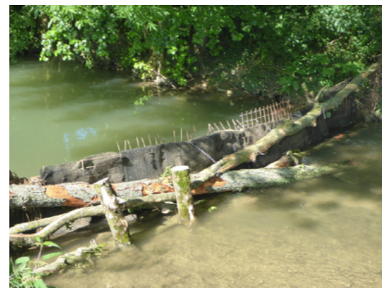
Filtre MES, 2018

Contactez le responsable technique de l'action : mduntze@peche02.fr