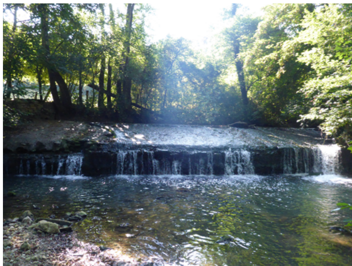
Site avant travaux, 2016