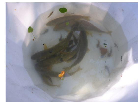
Pêche de sauvetage, 2018