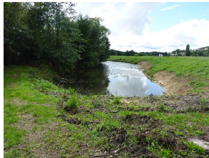
Site après travaux, 2014