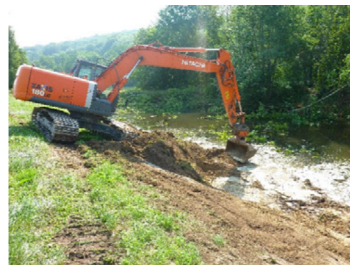
Terrassement et création d'une platière en pied de berge, 2014