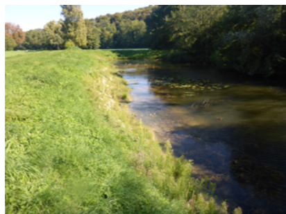
Site 1 an après travaux