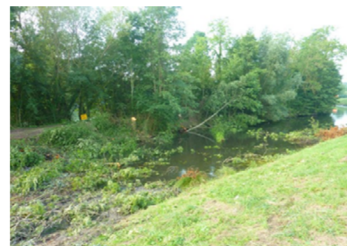
Entretien de la végétation arborescente, 2014