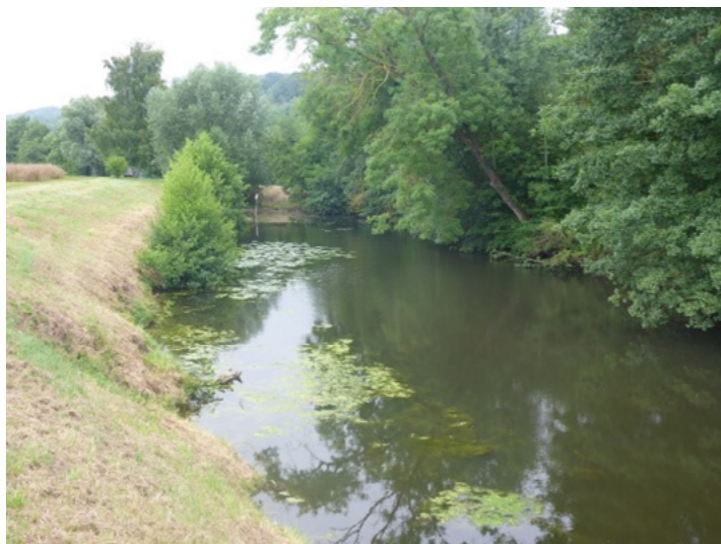
Site avant travaux, 2014