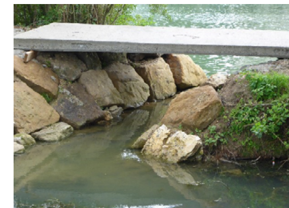
Site après travaux, 2014