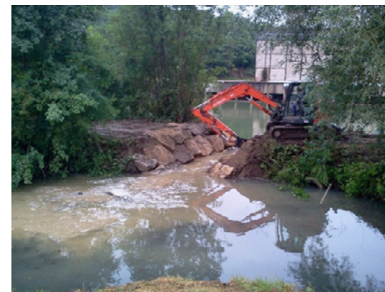
Restauration de la communication entre l'annexe hydraulique et la Marne, 2014

Contactez le responsable technique de l'action : rmarlot@peche02.fr