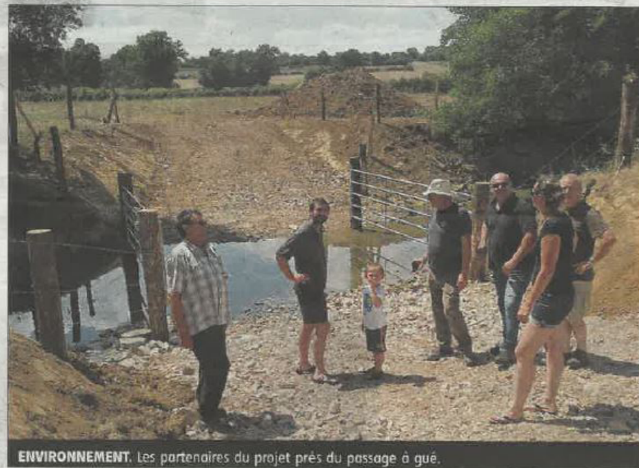
ENVIRONNEMENT. Les partenaires du projet près du passage à gué.

Conjointement pilotée par la Fédération de pêche de la Nièvre, les élus locaux et le monde agricole, cette opération de réaménagement, menée sur l'Auxois, rivière morvandelle, possède une double vocation. Il s'agit, en premier lieu, de redonner vie à ce cours d'eau, majoritairement peuplé de truites et de l'inclure dans un parcours de pêche. Puis, également, de valoriser un site localisé sur un nœud touristique, proche du canal du Nivernais et sur le chemin de Saint-Jacques-de-Compostelle.