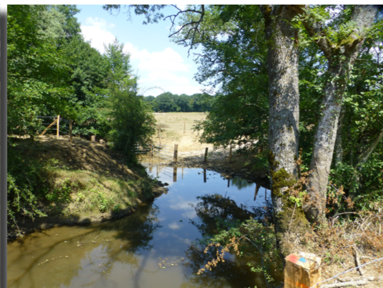
Site après travaux, Juillet 2018