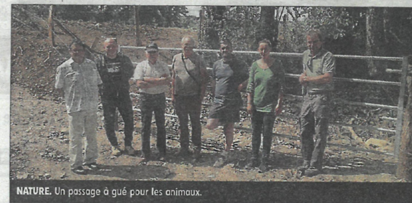
NATURE. Un passage à gué pour les animaux.

Le parcours d'une longueur de 4.5 km augmente favorablement le tracé déjà existant. Les travaux ont consisté en l'entretien de la végétation, la clôture