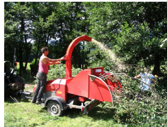
Entretien de la ripisylve, 2018