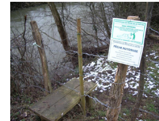
Echelier permettant le franchissement des clôtures pour les pêcheurs, 2019

Amélioration de la qualité hydromorphologique de l'Auxois.