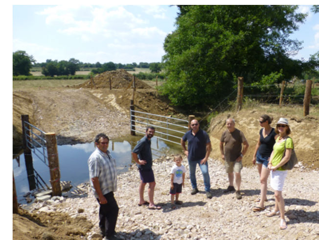
Réception de la 1ère phase de travaux avec les différents partenaires, Juillet 2018