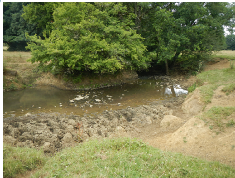
Site avant travaux, Juin 2018